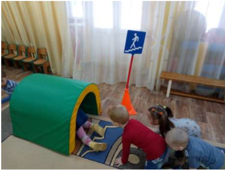
Игра «Красный, желтый, зеленый»