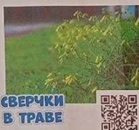
СВЕРЧКИ В ТРАВЕ