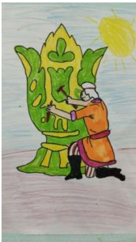
Инсценировка сказа «Серебряное копытце»