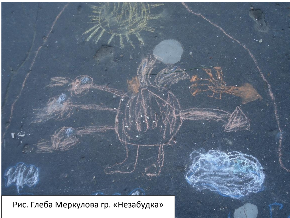
Рис. Глеба Меркулова гр. «Незабудка»