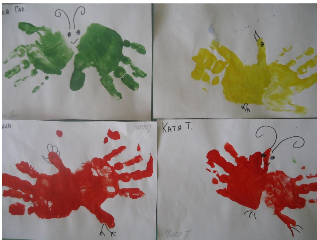
Работы детей гр. «Ландыши»