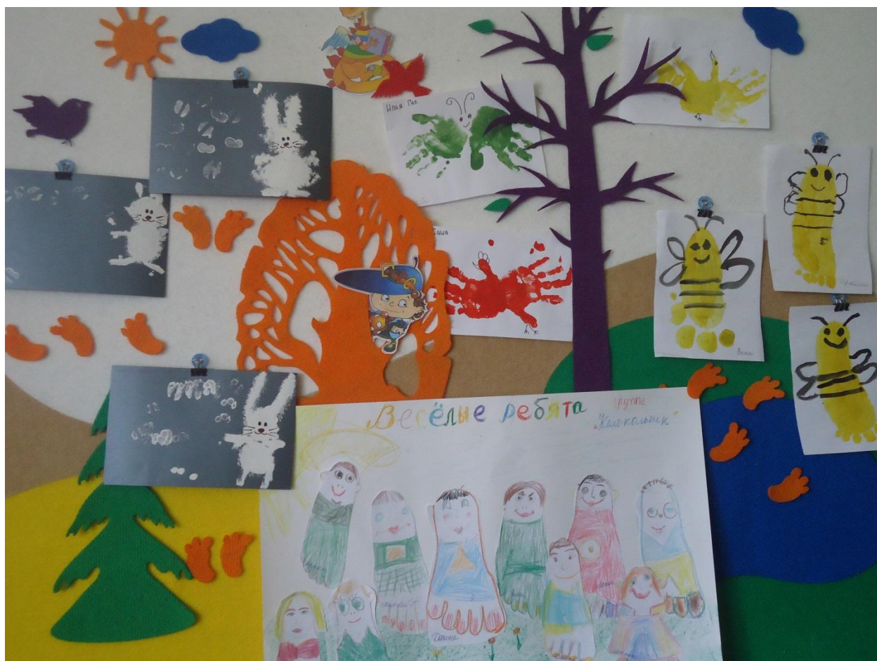
Поляна загадочных следов