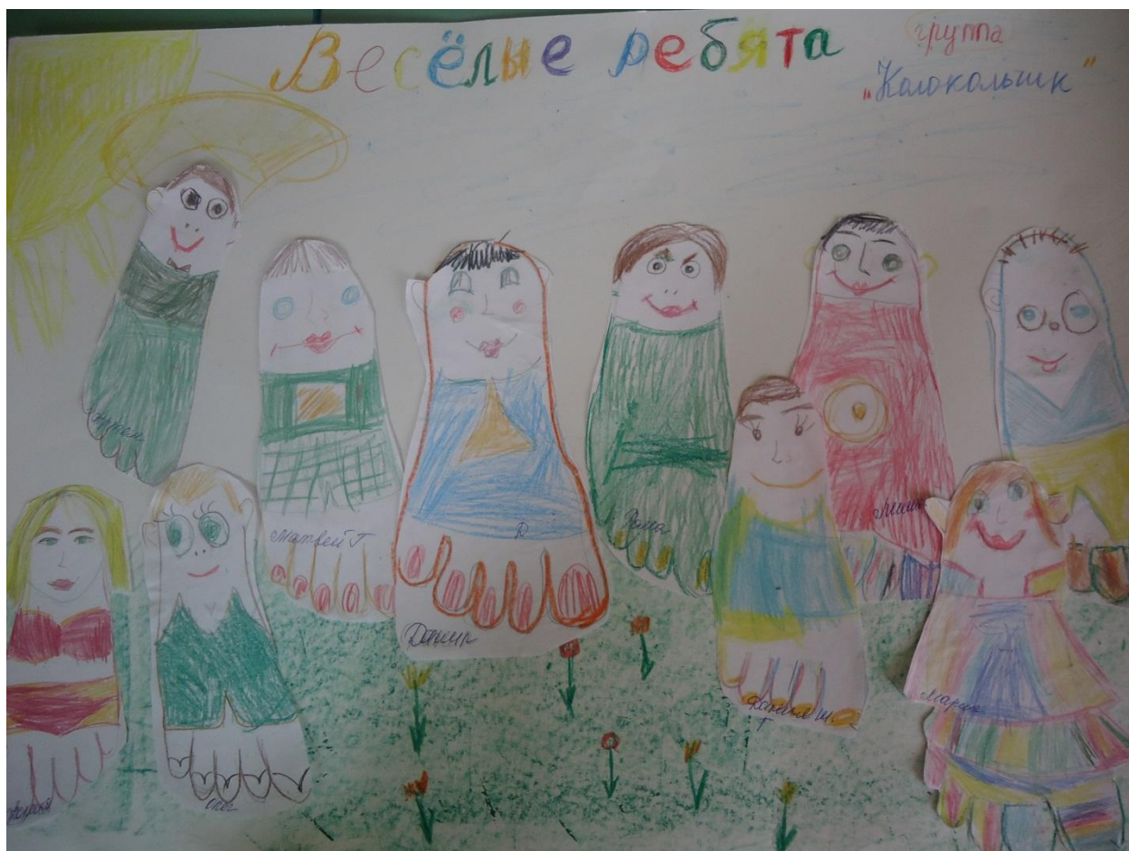
Коллективная работа гр. «Колокольчик»