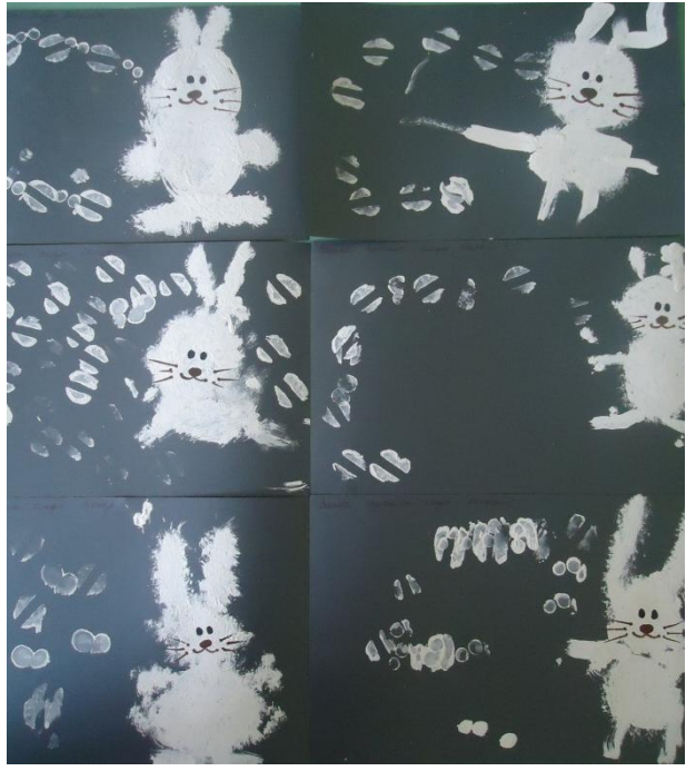
Работы детей гр. «Одуванчик»