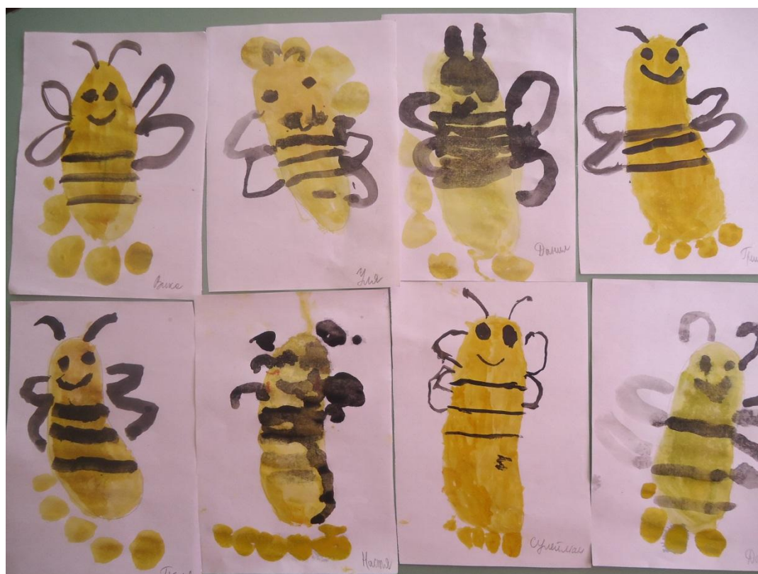
Работы детей гр. «Василек»