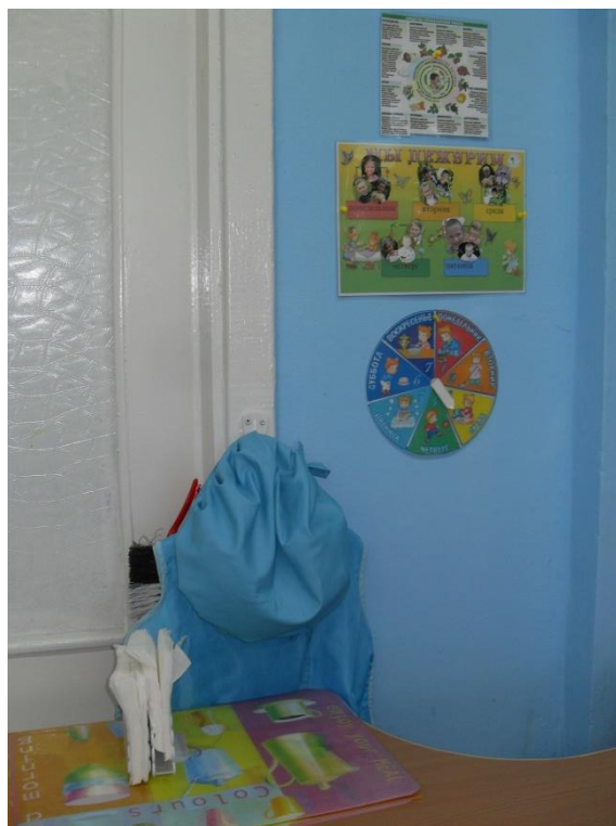
График дежурства с фотографиями детей, фартуки, чепчики для дежурства, щеточки и совочки для сбора мусора.