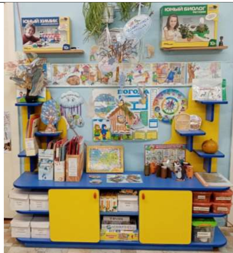
«Центр познания и коммуникации»

совочки, палочки. Материалы для рисования: поролоновый тампон, штемпельная подушка, губка, трафареты, печатки из картофеля, пробки, копировальная бумага, краски. Материалы для оригами. Картотека опытов.