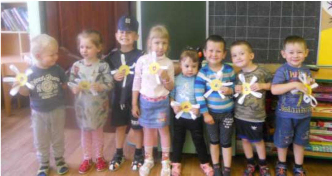
Ромашки группы «Ландыши»