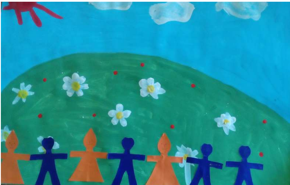
Коллективная работа группы «Василёк».

Пятый день мы посвятили семьям наших воспитанников- изготовили своими руками для родителей красивые сувениры и с наилучшими пожеланиями подарили их родным. Ребятами групп «Ландыши», « Василёк» и «Колокольчик» были изготовлены ромашки-обереги семейного счастья в предверии праздника День семьи, любви и верности.