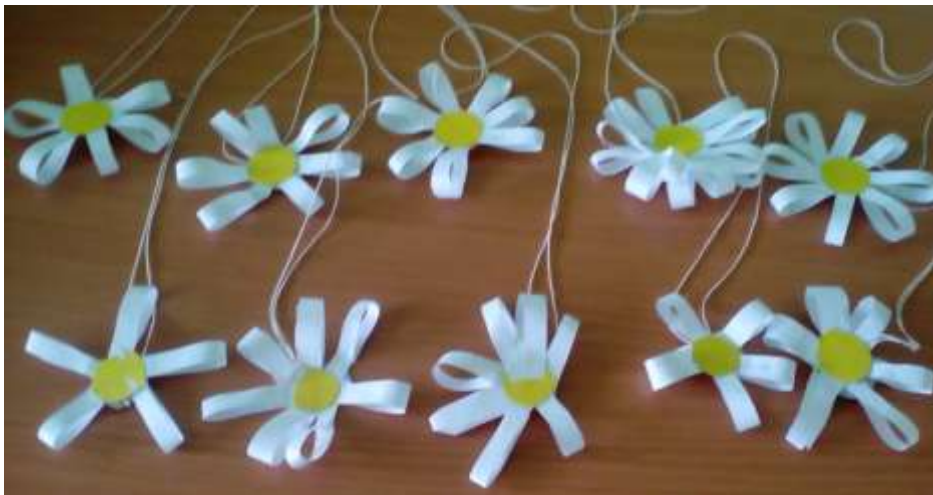
Ромашки группы «Васильки»