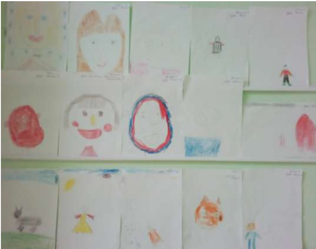
Выставка рисунков в группе «Колокольчик»