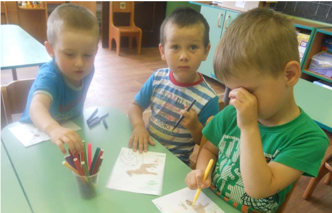
Рисование собачки в группе «Ландыши»

Последующие дни «Недели дружбы» прошли также с пользой, очень увлекательно. Мы открыли выставку рисунков «Мой друг», организовали просмотр мультфильмов о дружбе, песенки о дружбе, познакомились с разными видами приветствий.