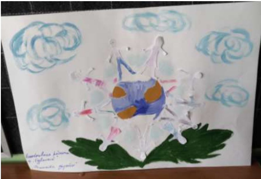
Коллективная работа группы «Одуванчик»