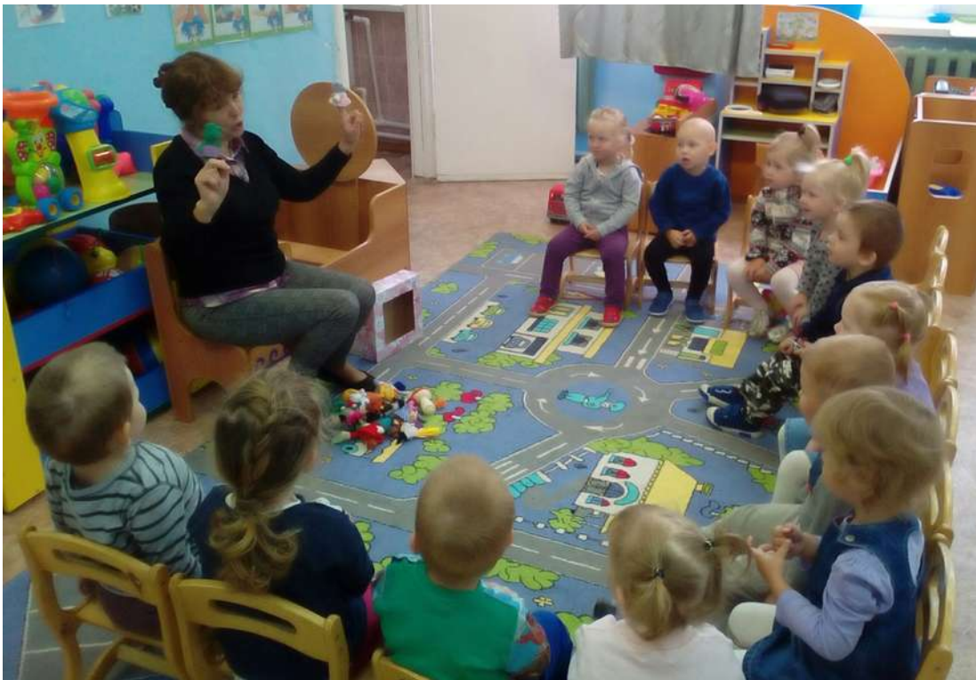
Беседа «Что такое дружба» в группе «Ромашка»

Воспитатели совместно с ребятами провели беседы «Что я знаю о друзьях», «Что такое дружба», прочитали стихотворения «Друг», «Подружка Маша», «Чей грибок?», «В детском садике детишки». В группе «Ромашка» дети разучили мирилки и научились мириться друг с другом.