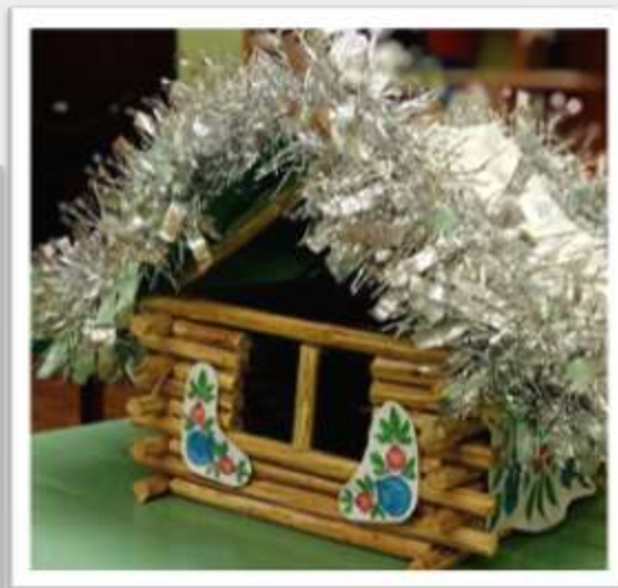
Работа семьи Насти Б.