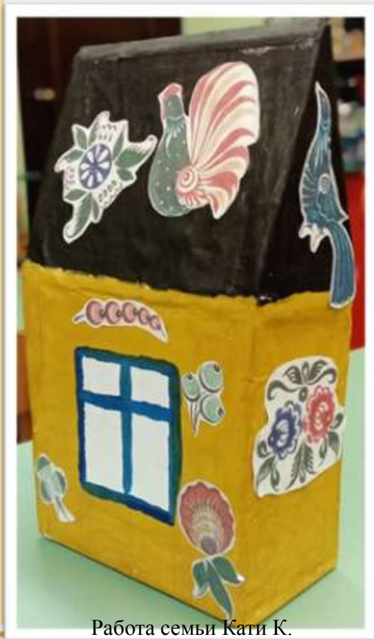
Работа семьи Кати К.