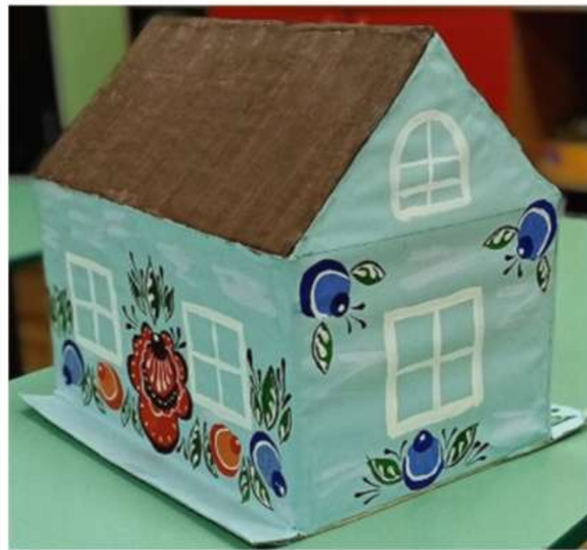
Работа семьи Макара Ч.