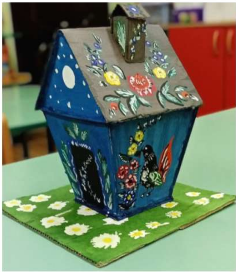
Работа семьи Макара Б