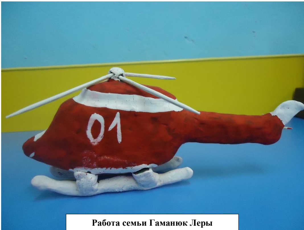
Работа семьи Гаманюк Леры