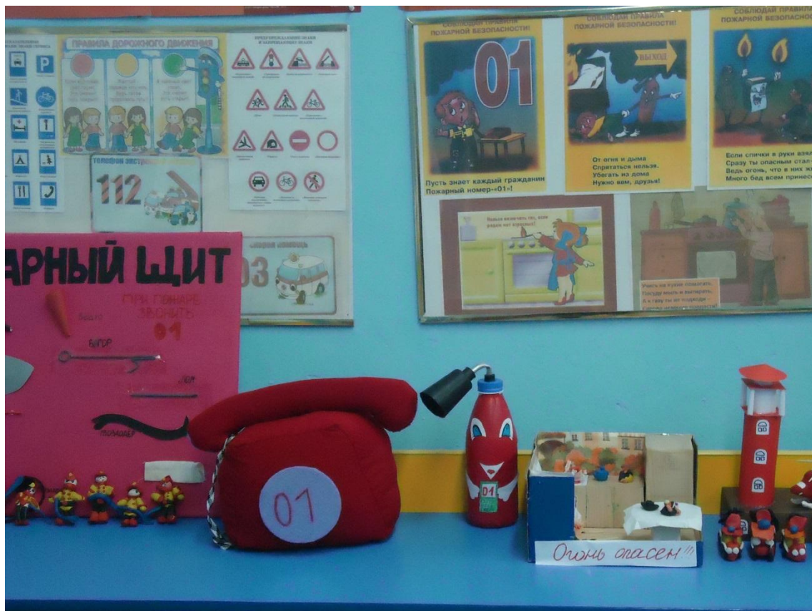
Оформление наглядной информации для родителей (консультации, памятки о ПБ, БЖД)