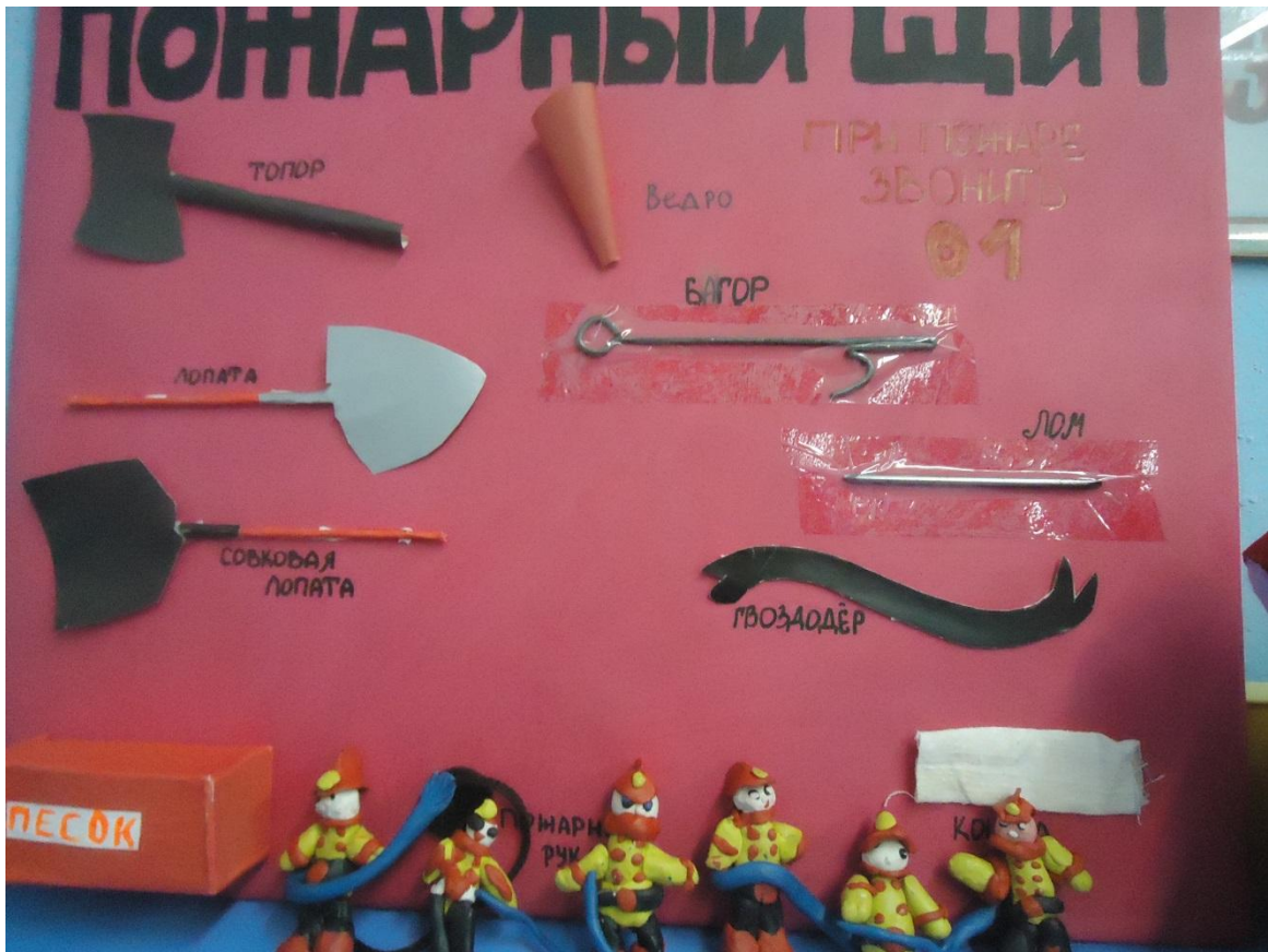
Совместная с родителями деятельность