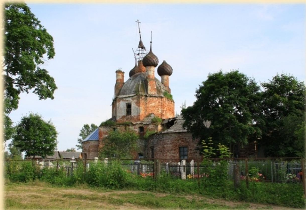
Церковь Покрова Пресвятой Богородицы