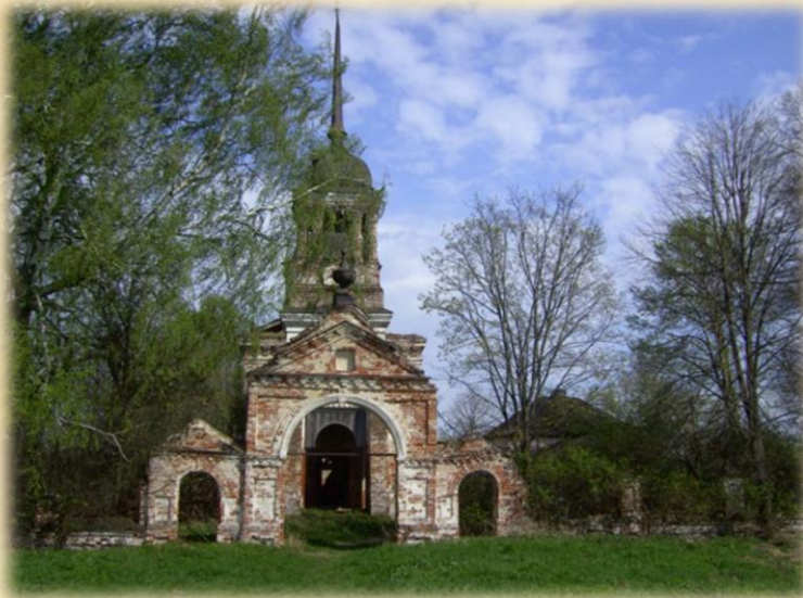
Церковь Иконы Божией Матери Всех Скорбящих Радость