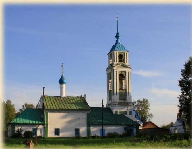
Церковь Спаса Всемилоостивого