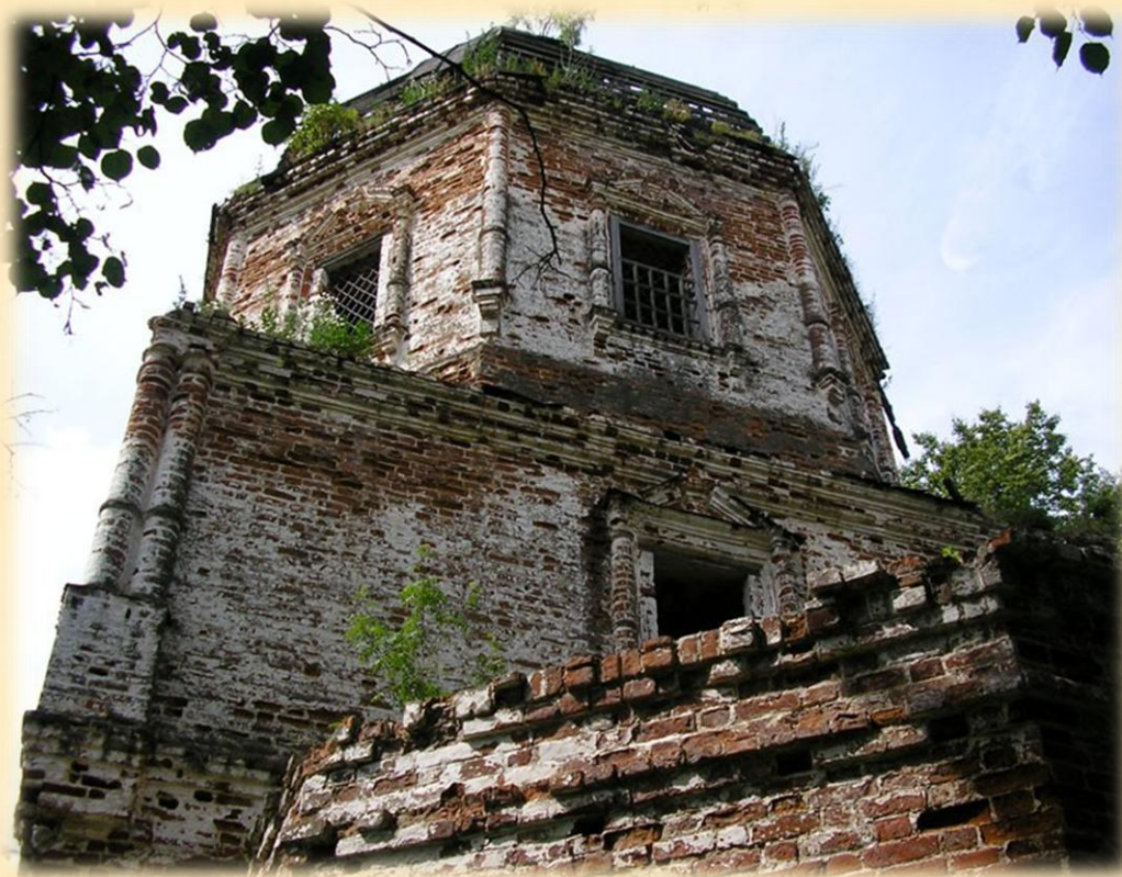
Церковь Михаила Архангела