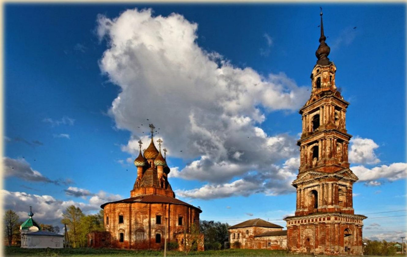
Храмовый комплекс Церкви Воскресенья Христова