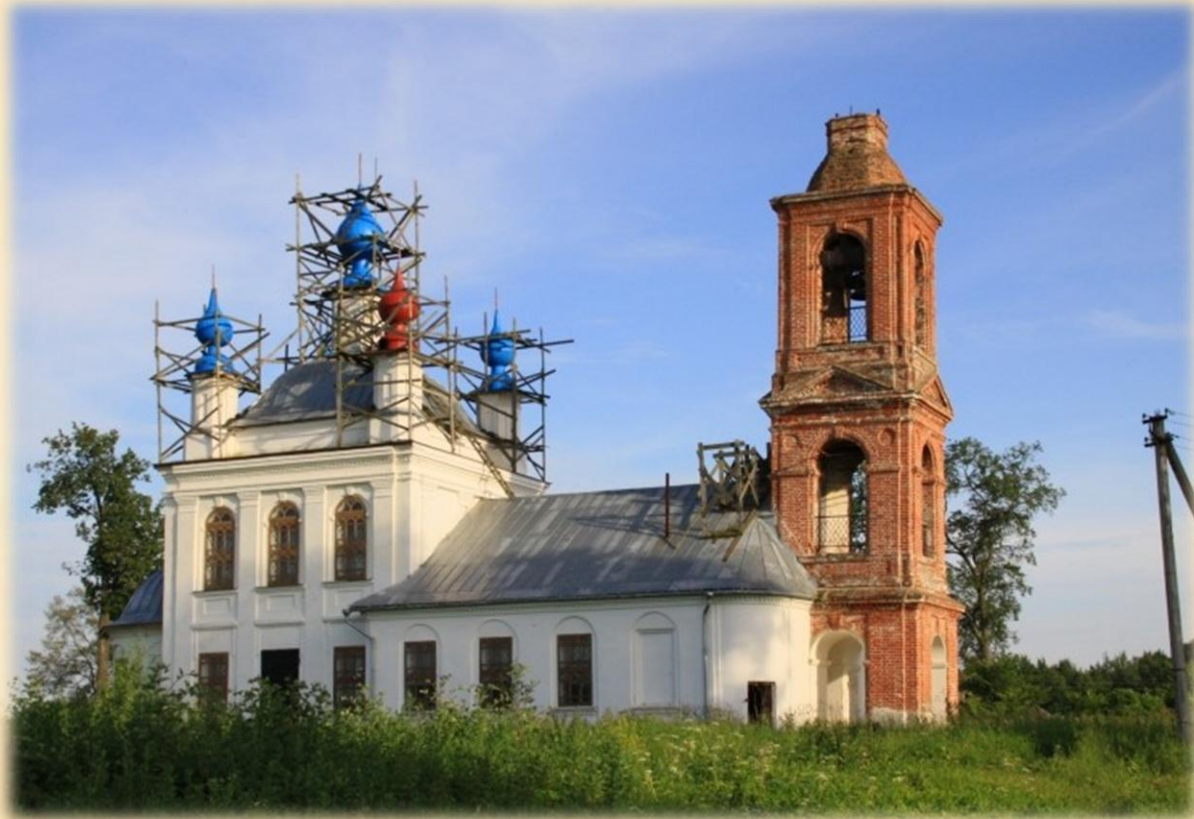
Церковь Успения Пресвятой Богородицы