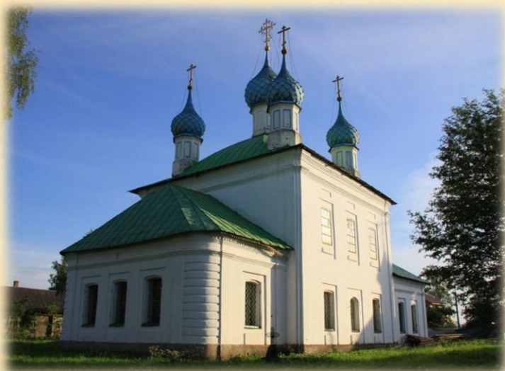
Церковь Иконы Божией Матери Смоленская