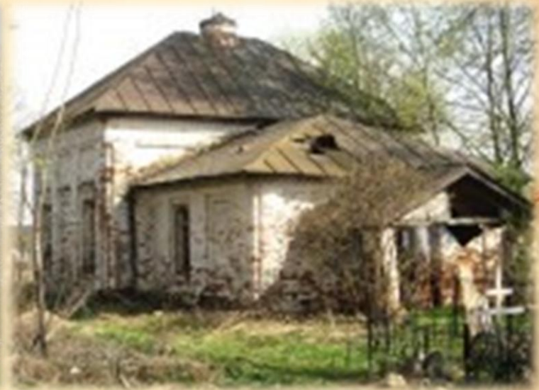
Церковь Николая Чудотворца