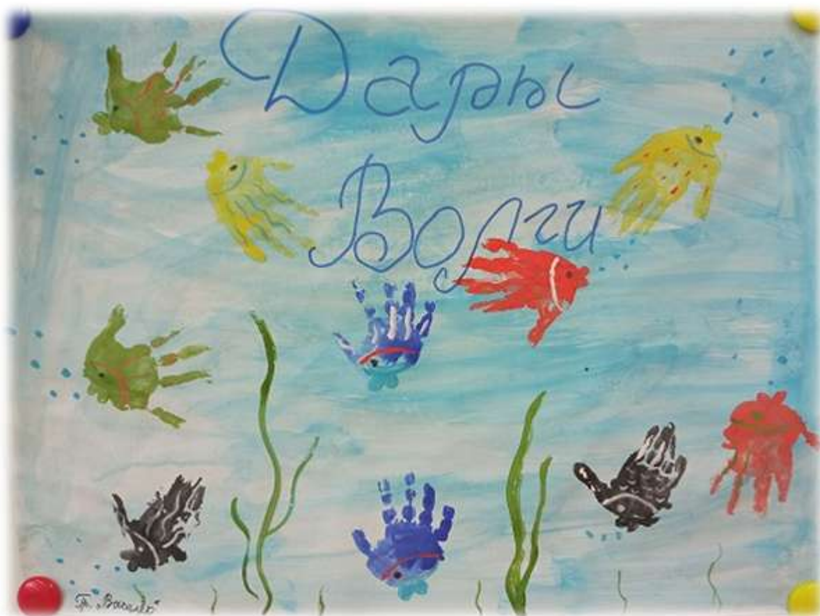
Коллективная работа «Дары Волги»