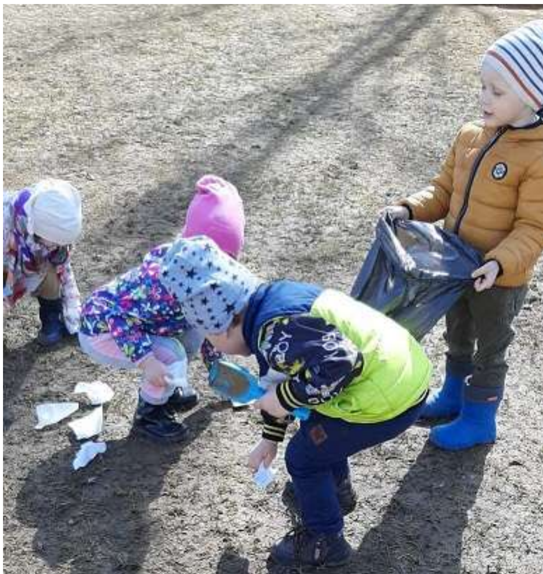
5. Продуктивная деятельность.