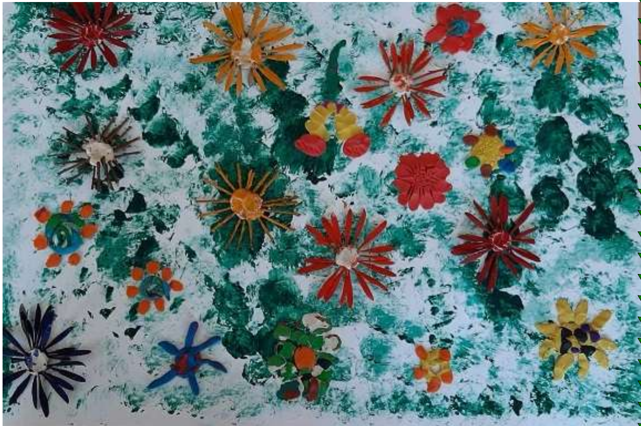
6. Наблюдения в природе.