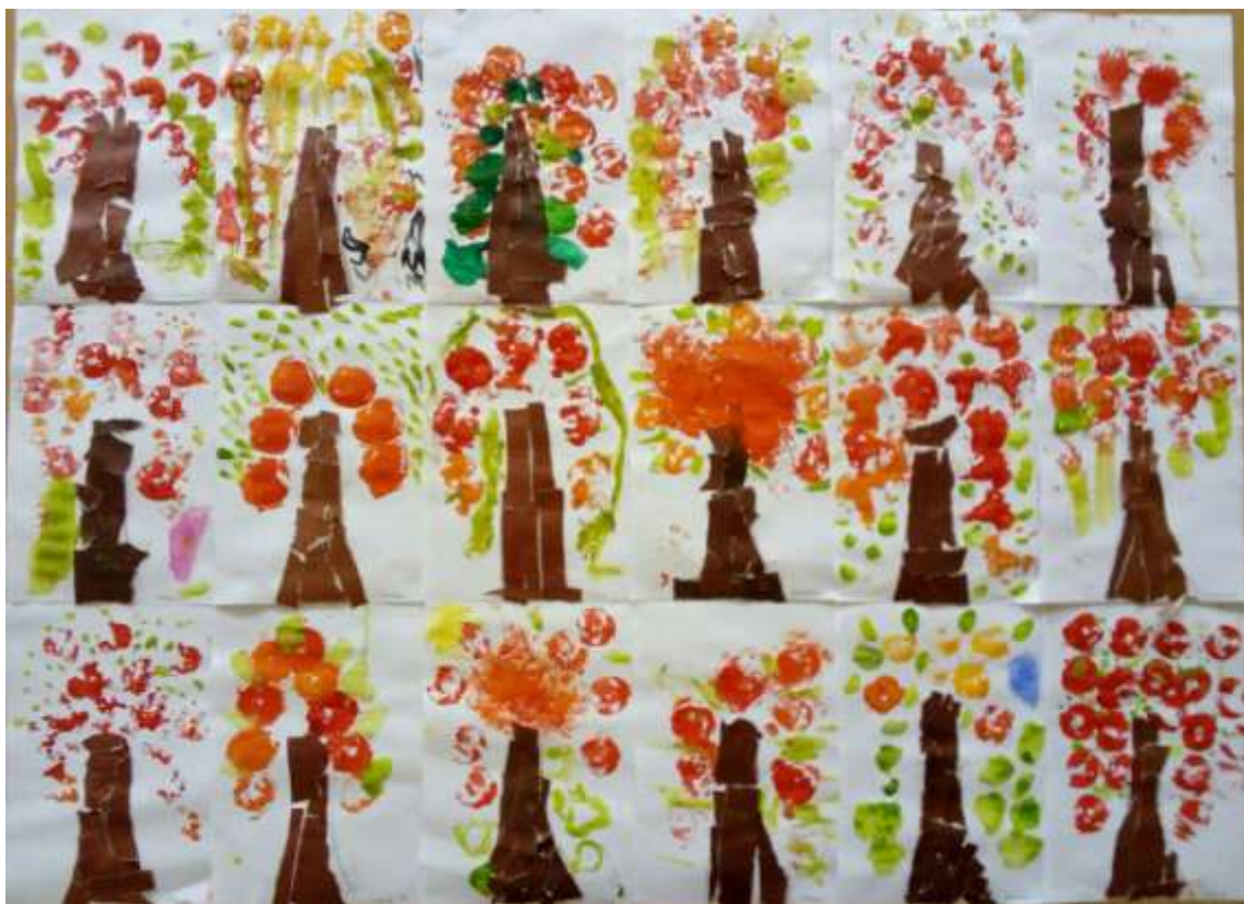
Рисование пальчиками «Ветка рябины»