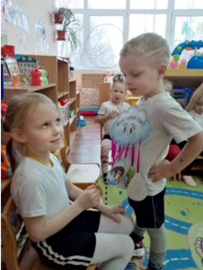
Ребята познакомились с обитателями рек.